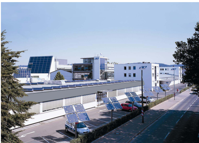
SMA-Firmengelände in Niestetal bei Kassel

Ab 18:45 Uhr Vorabendtreffen mit Buffet auf Einladung von SMA